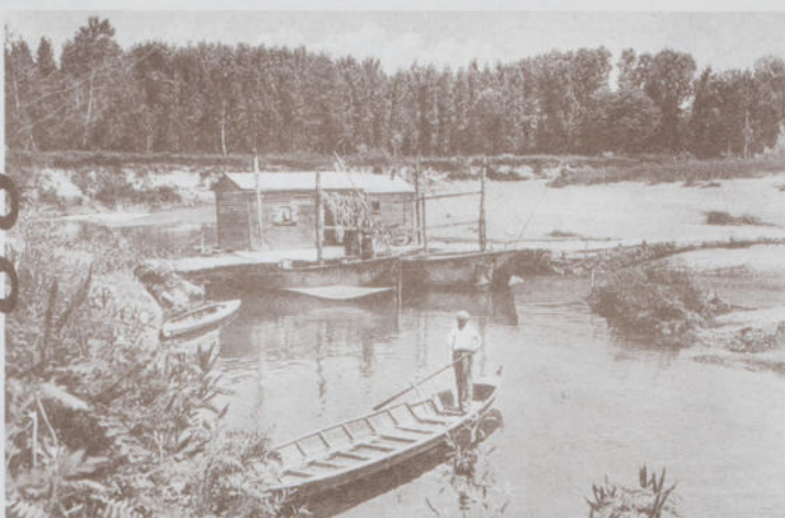
Traghietto sul torrente Scrivia