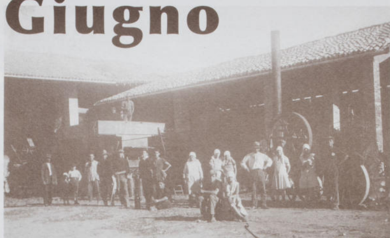
Antica trebbiatura - Anni '50