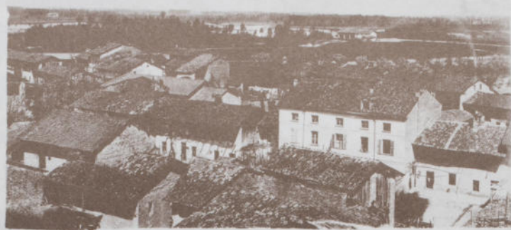
Veduta di Alzano Scrivia fine anni '40