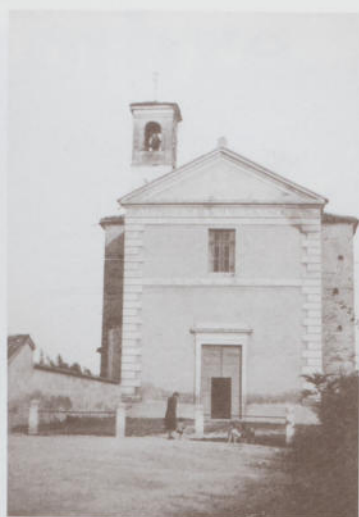
La chiesa parrocchiale - Anni '40-50