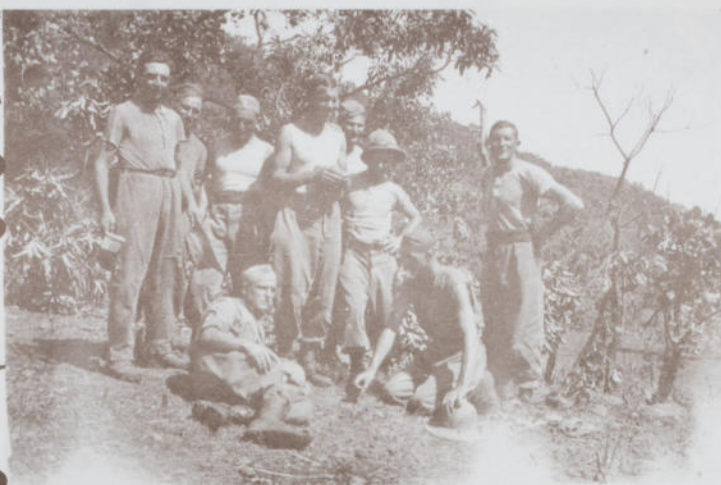
Alzanesi in Libia - 1936