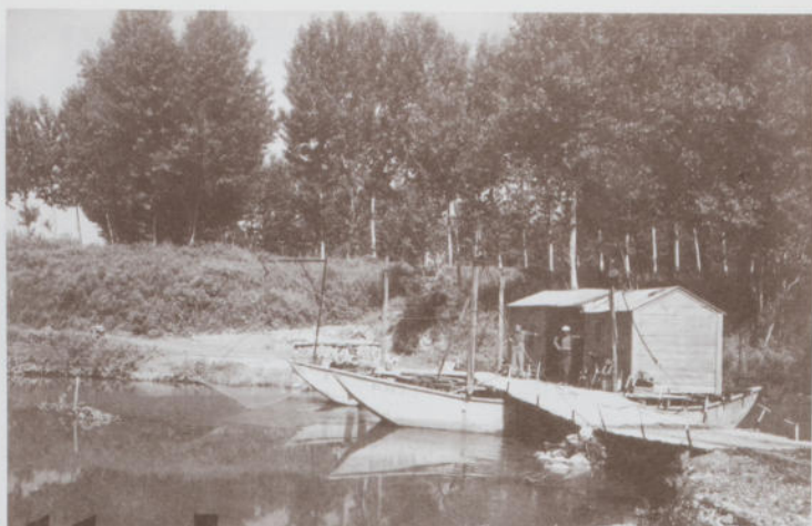
Traghetto sullo Scrivia