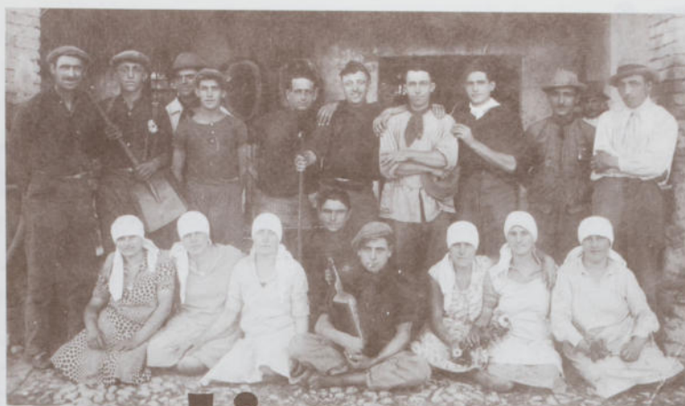
Gruppo trebbiatori in riposo - Anni '50