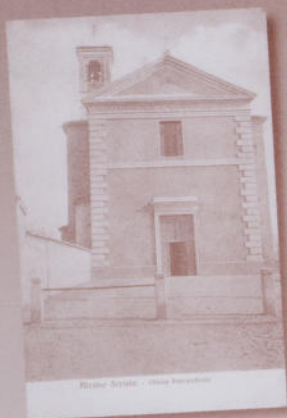
ALZANO SCRIVIA - Chiesa Parrocchiale