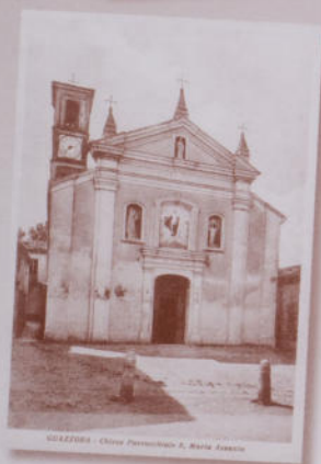
SCAZZANO - Chiesa Parrocchiale S. Maria Assunta