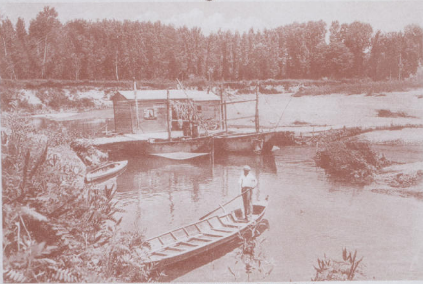
MULINO DEI TORTI - Traghettino sul Torrente Scrivia