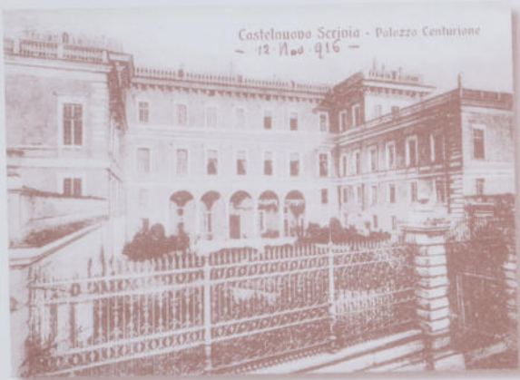
Castelnuovo Scivria - Palazzo Centurione - 12. No. 416 -