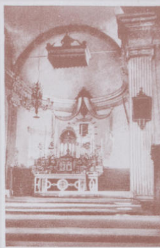
ALZANO SCRIVIA - Chiesa Parrocchiale