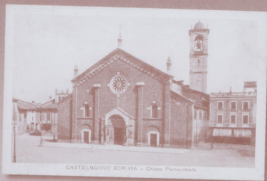
CASTELNUOVO SCRIVIA - Chiesa Parrocchiale