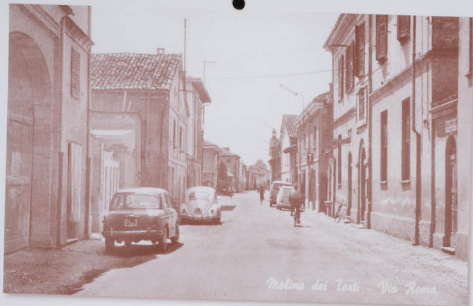
Molino dei Torti - Via Roma