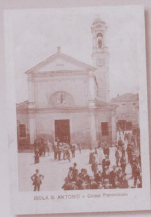
ISOLA S. ANTONIO - Chiesa Parrocchiale