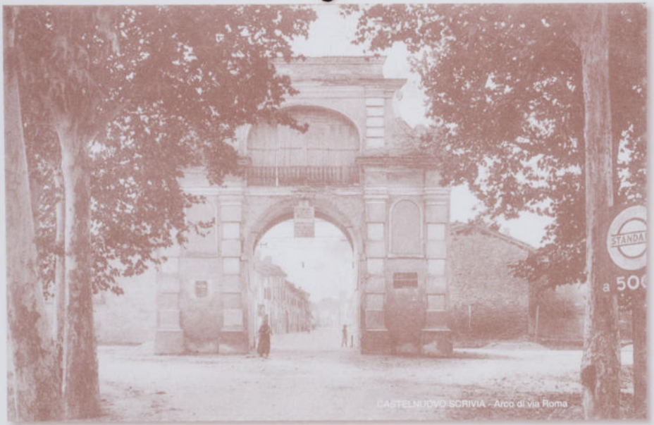
CASTELNUOVO SCRIVIA - Arco di Via Roma