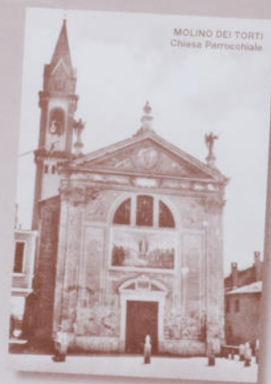
MOLINO DEI TORTI Chiesa Parrocchiale