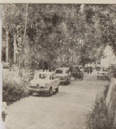
la riposante località boschiva — PONTE SUL PO (AL)

Il procuratore della Repubblica di Voghera ha concluso l'istruttoria sul grave episodio e nella prossima settimana firmerà la richiesta del rinvio a giudizio dei tre giovani dinanzi alla Corte d'Assise di Pavia.