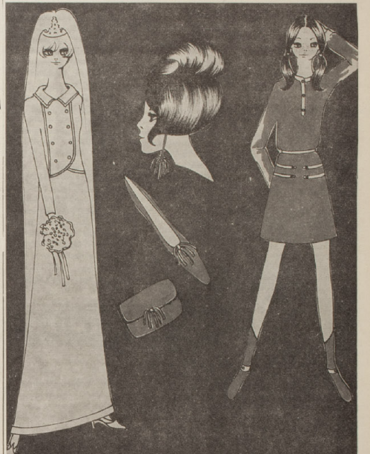
1) Abito da sposa lungo con giacca tipo tailleur con velo lungo. 2) Acconciatura da sera con orecchini pendenti, lo stesso motivo di questi riportati sulle scarpe e borsetta. 3) Abito alla yé yé con stivaletti.

berretti scozzesi dello stesso tessuto del tailleur o cappotto che indossate. Gli stili che vanno per la maggiore sono alla monello e a casco,