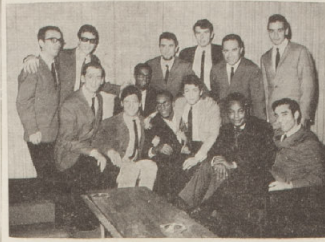
Siamo lieti di annunciare agli amici che il complesso orchestrale del Maestro Gianni De Giovanni di Guazzora ha ottimamente iniziato la stagione musicale nel miglior edanzing di Teheran, capitale della Persia, ed ha prestato lodevoli servizi alla Corte Reale, presentando lo Scia e l'Imperatrice Fara Diba, facendosi eleggere per la bravura, la tecnica e l'eccellenza delle esecuzioni.

vuta l'acqua dell'abbeveratoio che, all'insaputa della gente andava inquinandosi, morì intossicato e si sparse la notizia che il tedesco Allora il soldato fu circondato dai soldati inferociti che lo linciarono, lo obbligarono a «sfilare» per le vie del paese, mentre le donne uscivano dalle case per colpirlo al viso con lo zoccolo, lo seguiva la folla imbestialita. Terrorizzata, piangendo, sfinito dalla busse, il soldato, che fu poi portato in una stalla ed adagiato su di un mucchio di paglia, mi riconobbe, in mezzo ai suoi agionni e disse, con