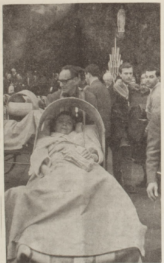
Un'infornata castelnovese in carrozzella, spinta da un Dottore volontario barelliere verso la Grotta dell'Apparizione della Vergine Lourdesiana.