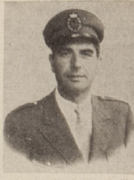
Per due anni Capo Guardia di una ditta imbarchi e sbarchi nella Società Rapid, nel 1936 vinse il concorso di guardia comunale di Isola S. Antonio, mansione che espletò lì, fino al 1967.