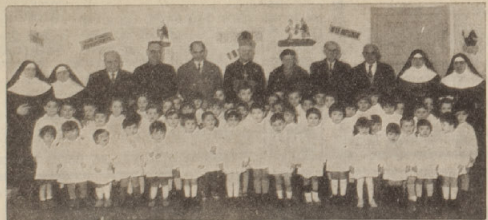
Mons. Vescovo tra i bambini dell'Asilo.