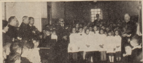
Mons. Vescovo alle Scuole Elementari di Stato.