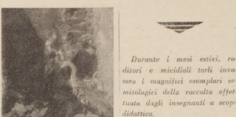
Gli uccelli al cirogo

Durante i mesi estivi, roditori e micidiali tarli invadono i magnifici esemplari ornitologici della raccolta effettuata dagli insegnanti a scopo didattico.