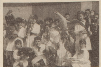
Gli uccelli prima di essere dati alle fiamme