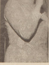
Castelnuovo Scrvia