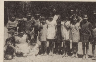
CASTELNUOVO S. Un «vespaio» di bambini allegri e vivaci alle case popolari di via Santo Stefano Bandello.