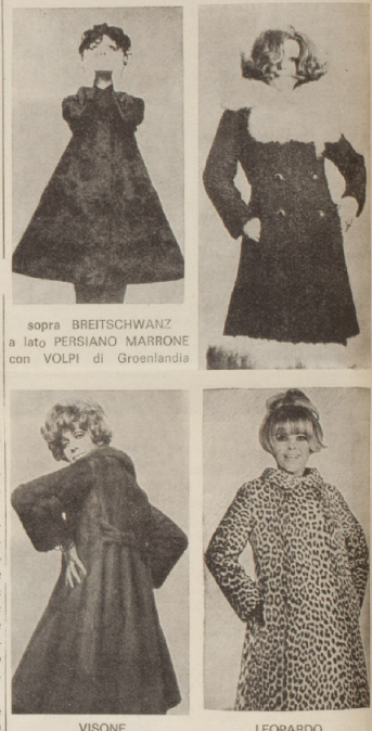
sopra BREITSCHWANZ a lato PERSIANER MARRONE con VOLPI di Groenlandia VISIONE LEOPARDO

la nuova pelliccia da confezionare su misura, nei modelli 1969 - 1970.