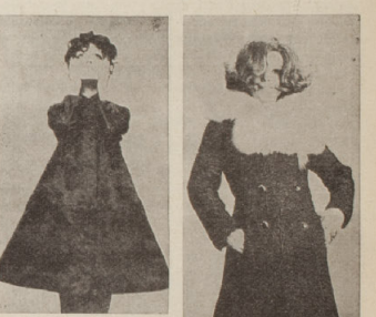
sopra BREITSCHWANZ a lato PERSIANO MARRONE con VOLPI di Groenlandia