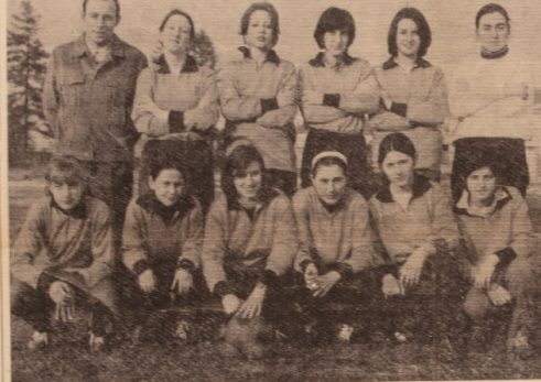
La rappresentativa femminile del Gruppo Sportivo Isola - Guazzora vittoriosa per 7 reti ad 1 sulla «Juvenilia» di Castelceriolo.

La gara, che ha sufficientemente divertito il pubblico, è stata vinta per 7 reti ad 1 dalla Rappresentativa locale, la cui portiere ha saputo parare ben due rigori. Ha ot-